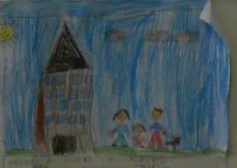
VANNO A VIVERE IN UNA CASATA ZAVELIN