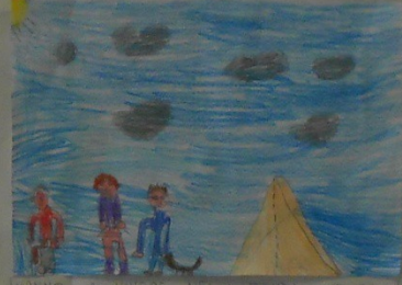
VANNO A VIVERE NELLA TENDA CHE SI ERANO PORTATI PER LA PASSEGGIATA REANNA NELLE