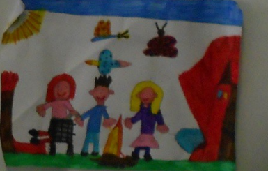
VANNO A VIVERE IN UNA CASATA VIOLA GABRIELE