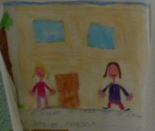
VANNO A VIVERE IN UNA CASATA SILVA VANESSA