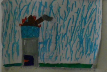
PER SPENDERE IL FUECO SILVA MIKO