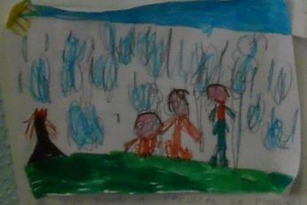
VANNO A VIVERE IN UNA CASATA DEVI ALVARO