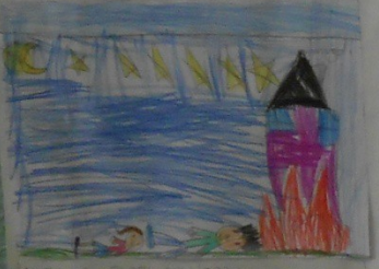
DORMONO NELLA SILLERIA MARTINA