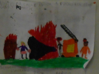
VANNO A VIVERE IN UNA CASATA RABELO