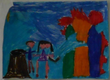
COME SPENDO IL FUECO E LA CASA DI SILVIA LEILA E VIMPER